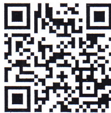
(แบบประเมินหลัง)

๑๐. ขอให้ผู้เข้าสอบทุกคน ทำแบบสอบถามเพื่อประเมินผลการป้องกันการแพร่ระบาดของโรคติดเชื้อไวรัสโคโรนา 2019 (COVID-19) ภายหลังจากเข้ารับการประเมินสมรรถนะ (สอบสัมภาษณ์) ไปแล้ว โดยให้สแกน QR Code หรือเข้าไปที่ https://forms.gle/jEFB2JbYaVctod6F7 โดยสามารถตอบแบบสอบถามได้ตั้งแต่วันที่ ๒๐ - ๒๓ สิงหาคม ๒๕๖๔ เพื่อการติดตามผลและป้องกันการแพร่ระบาดของโรคติดเชื้อไวรัสโคโรนา 2019 (COVID-19)